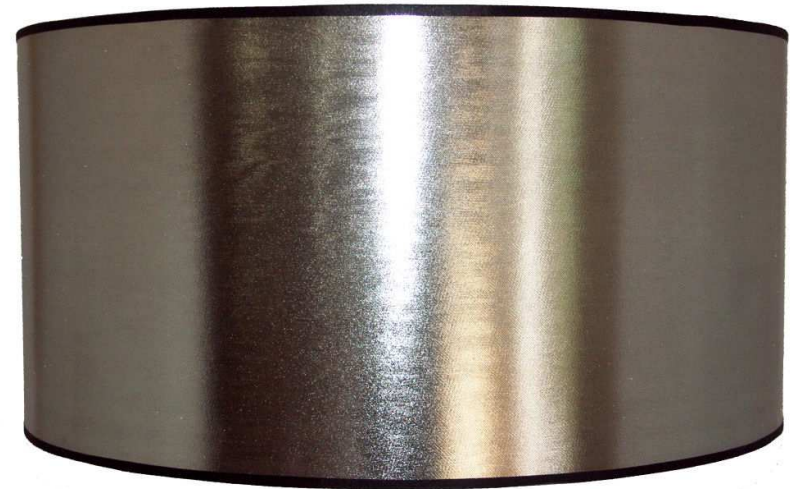
Lamé argent intérieur noir

Suspension cylindrique de diamètre 40 à 80 cm (au-delà, nous consulter) disponible dans un PVC miroir translucide ou un lamé argent contre collé sur PVC noir